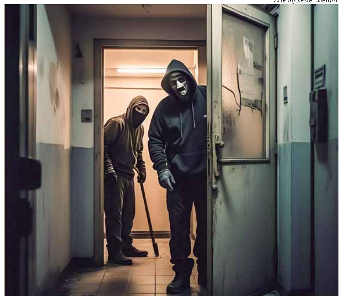
Arte Infoleste: MetaAI

Em contraste com os números impressionantes da zona leste e sul, a região norte apresentou 6.368 casos de roubo no primeiro semestre de 2024. Em junho, a região contabilizou 989 casos de roubo. O levantamento do barômetro da Verisure aponta que sábado é o dia que contabiliza mais ocorrências, entre 00h e 08h.