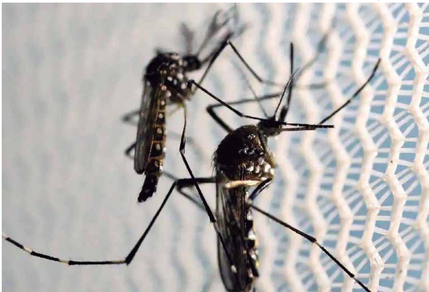
O mosquito Aedes aegypti é muito parecido com um pernilongo comum, é mais escuro e possui listras brancas pelo corpo e pelas patas

Os sintomas mais informados aos profissionais da rede de saúde são, conforme registra o governo estadual, febre, cefaleia (dor