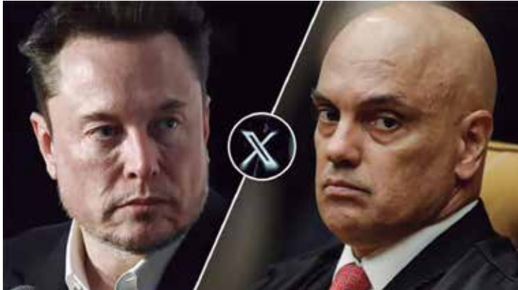
Musk desafia Moraes a debater "abertamente" pressões feitas ao "X"

O ministro do Supremo Tribunal Federal (STF), Alexandre de Moraes, determinou a inclusão do multibilionário Elon Musk entre os investigados do chamado Inquérito das Milícias Digitais (Inq. 4.874), que apura a atuação criminosa de grupos suspeitos de disseminar notícias falsas em redes sociais para influenciar processos políticos.