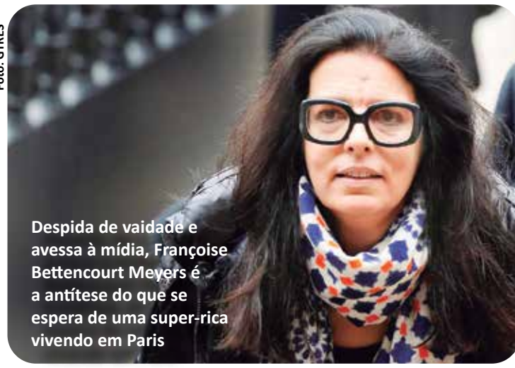
Despida de vaidade e avessa à mídia, Françoise Bettencourt Meyers é a antítese do que se espera de uma super-rica vivendo em Paris

Em oposição ao império dos cosméticos que herdou, ela raramente